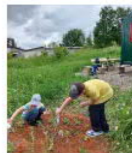
Bilder und Text: U. Schnell

Am 21.5. ergänzte die Ortsgruppe das vom Grundschulverband angebotene Ferienprogramm mit einer Aktion am neuen Bauwagen – dem Haus Löwenzahn. Die Kinder haben eine Fläche neben dem Bauwagen für eine Wildblumenwiese freigeräumt. Es machte ihnen sichtlich Spaß in der „Erde zu wühlen“. Sogar ein Stein mit Fossil wurde gefunden. Anschließend wurden Wildblumen auf der Fläche gepflanzt und zusätzlich noch welche ausgesät. Wir sind gespannt, wie es sich entwickelt!