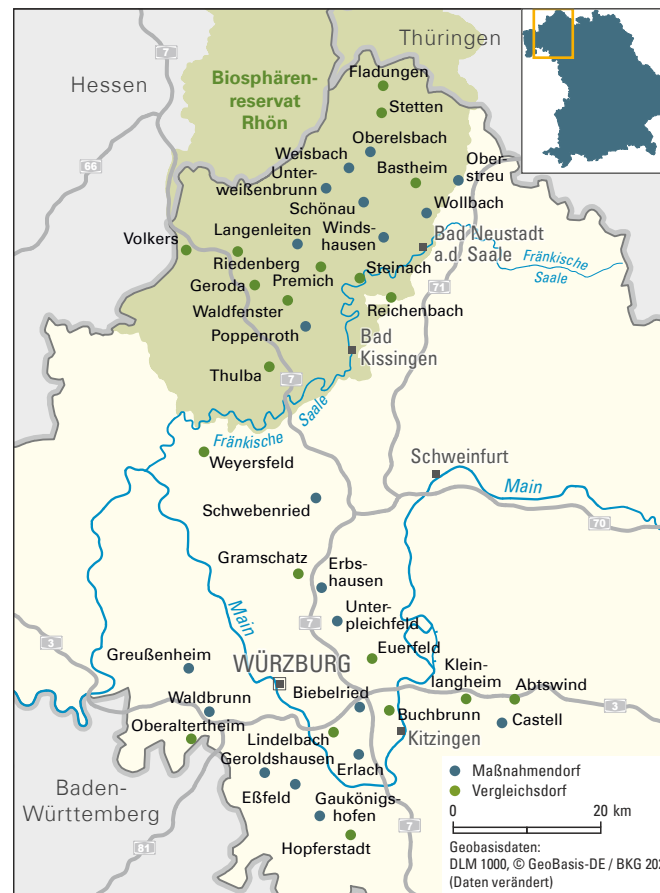
Karte der teilnehmenden Dörfer